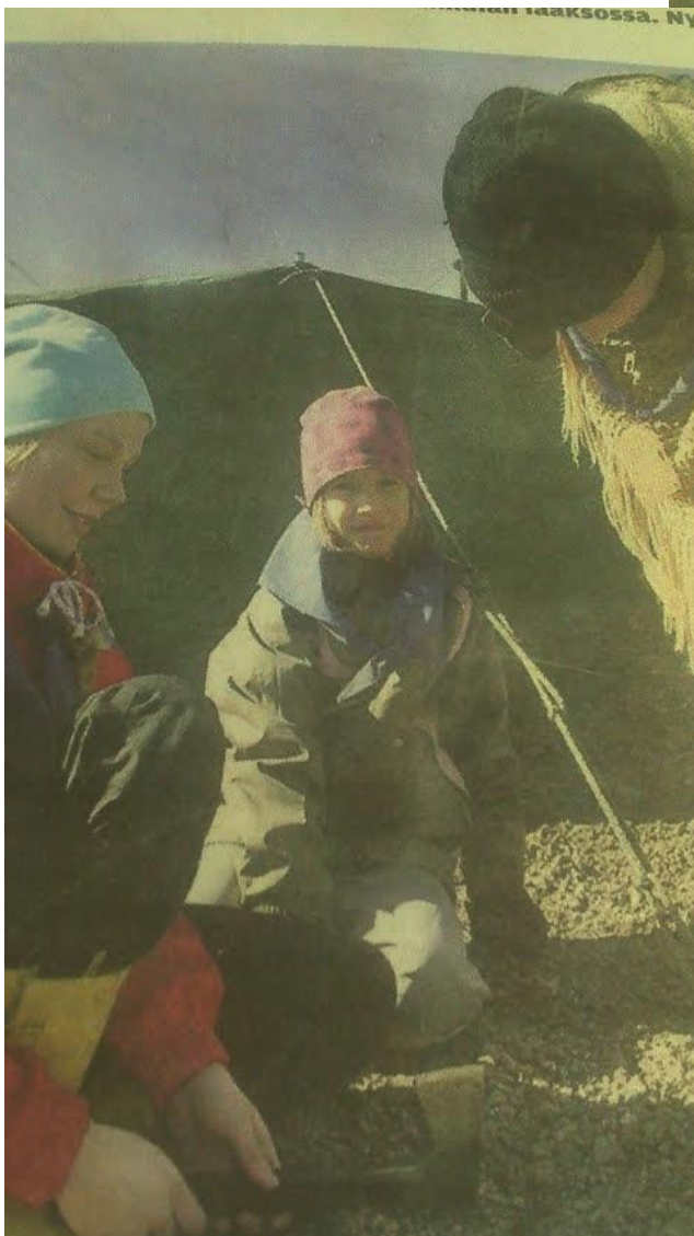
Alkaisemmin leirejä on järjestetty Kenkäkukulan laaksossa. Nyt siellä lainehti pieni järvi.